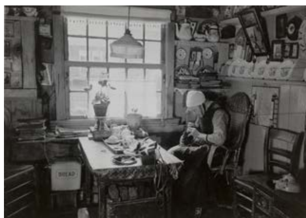
Vrouw in streekdracht in een traditioneel interieur uit eigen collectie (foto AA 564, opname juni 1943).